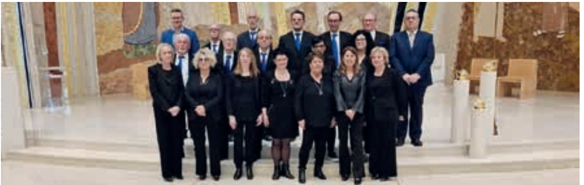
Coro San Pietro di Rosà (VI)