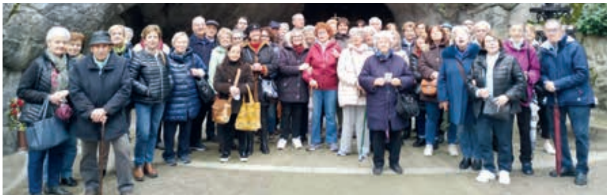
UP San Bortolo di Vicenza