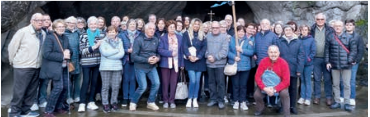
Carmignano di Brenta (PD)