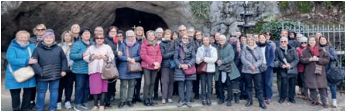
San Pietro di Rosà (VI)