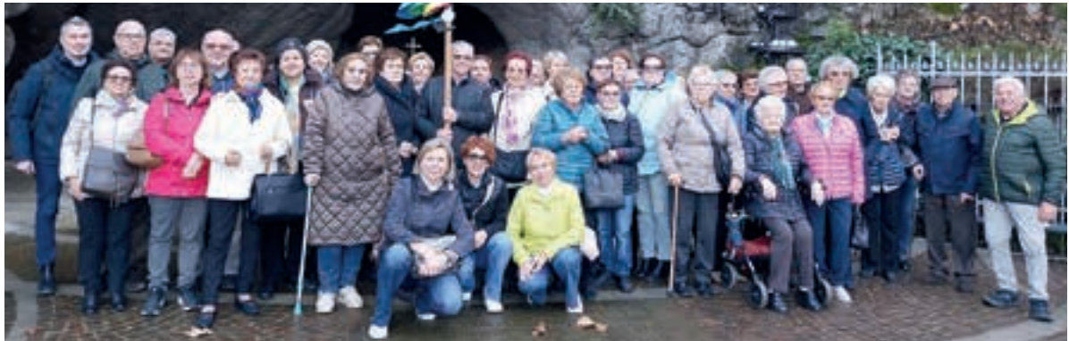
Grumolo delle Abbadesse (VI)