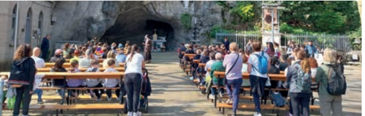
Montecchio Maggiore (VI)